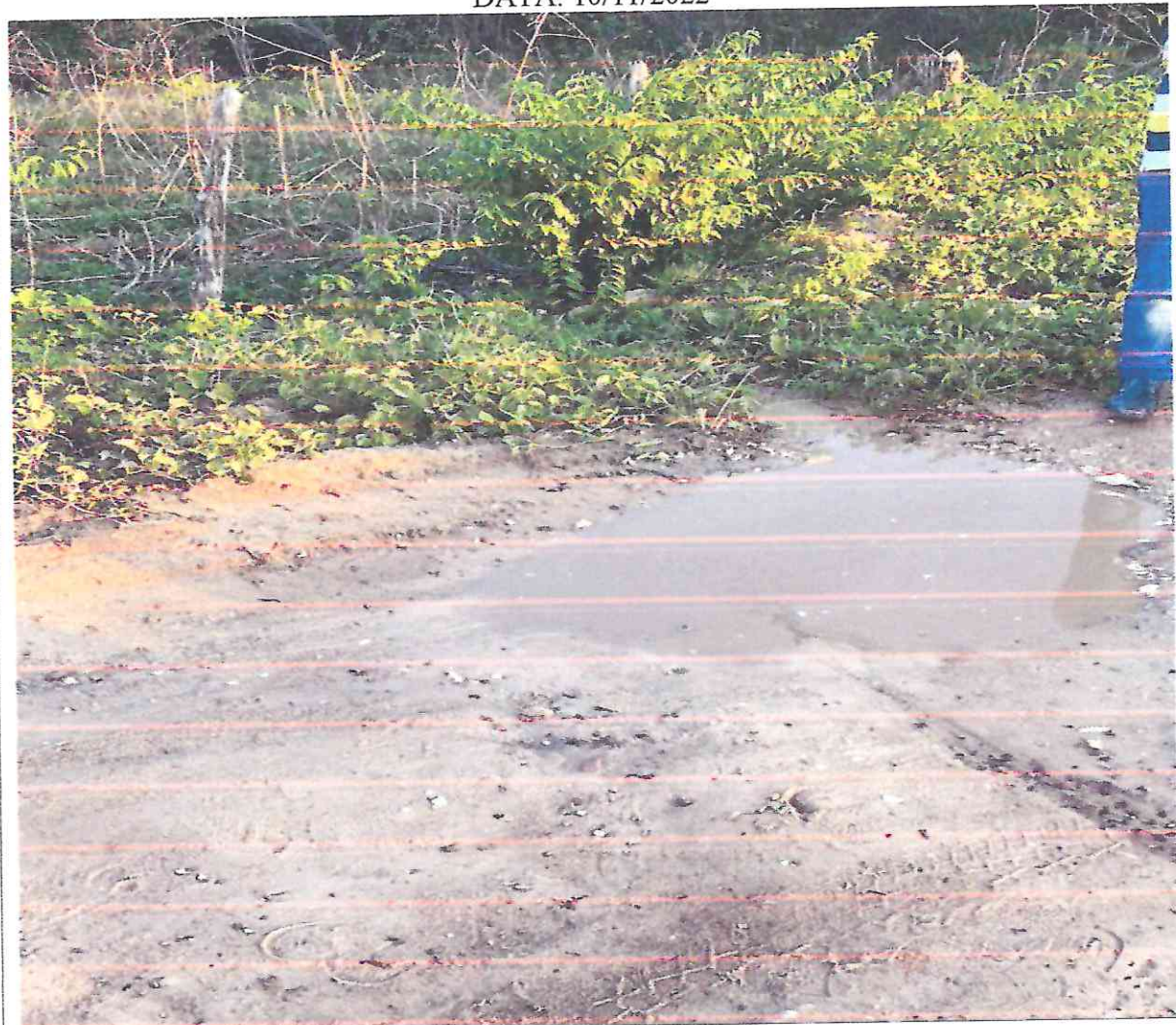
Figura 7: imagens do local da obra