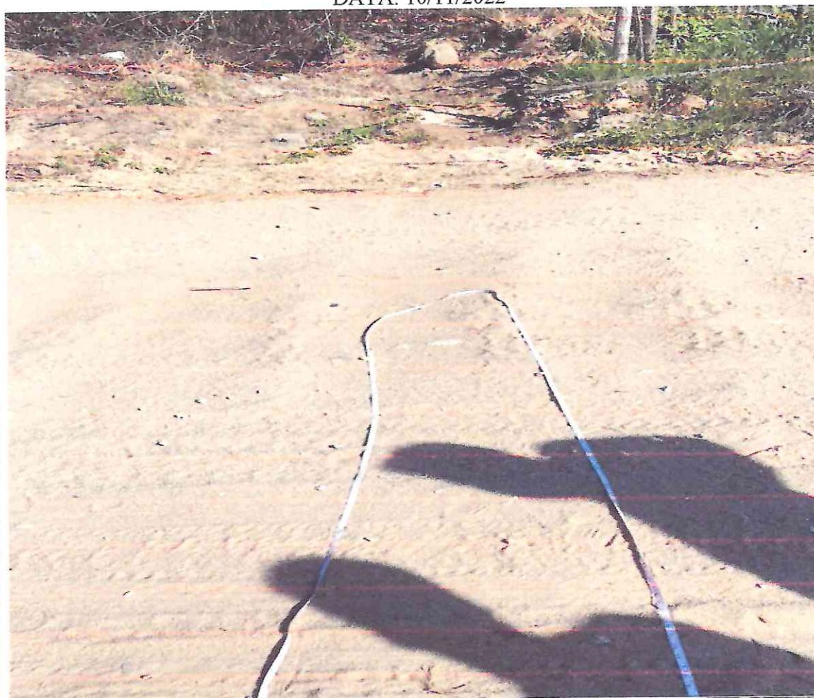
Figura 2: imagens do local da obra