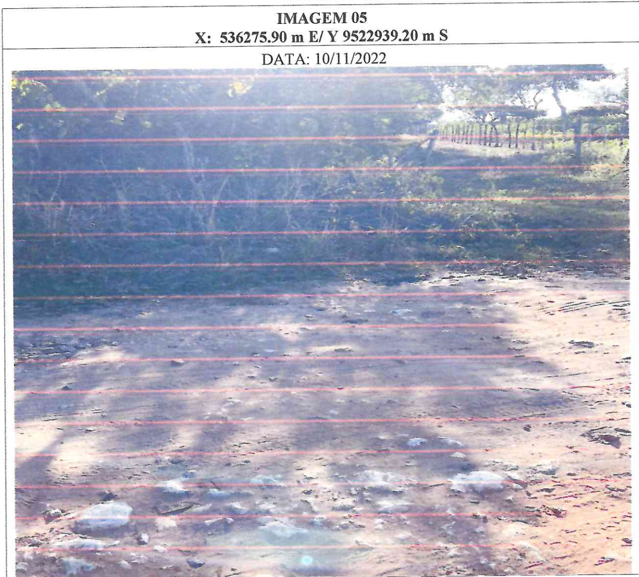
Figura 5: imagens do local da obra