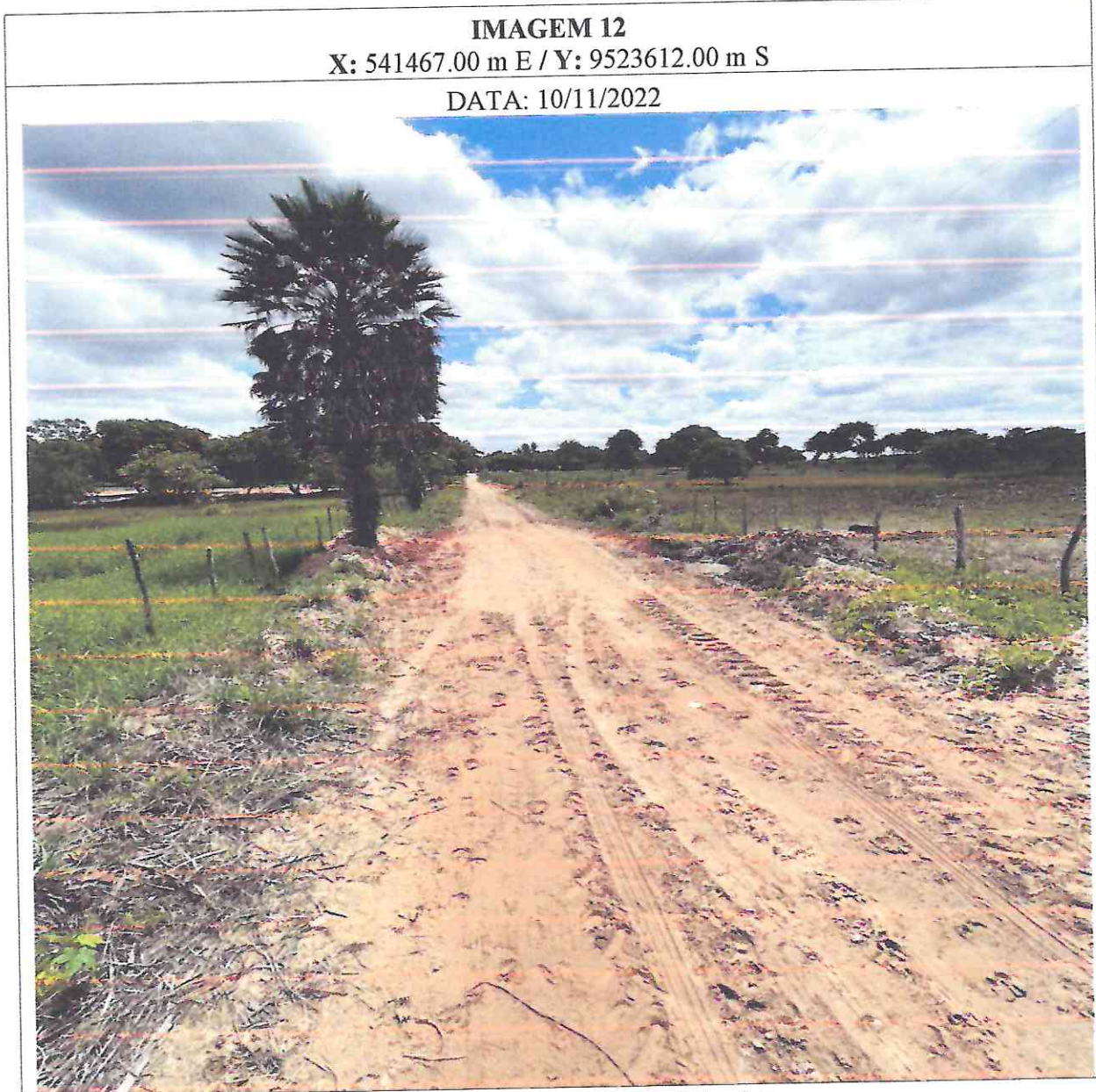
Figura 12: imagens do local da obra