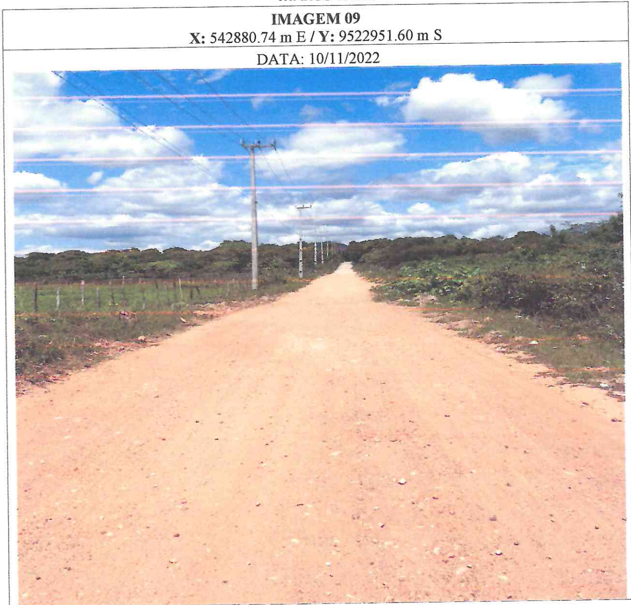
Figura 9: imagens do local da obra