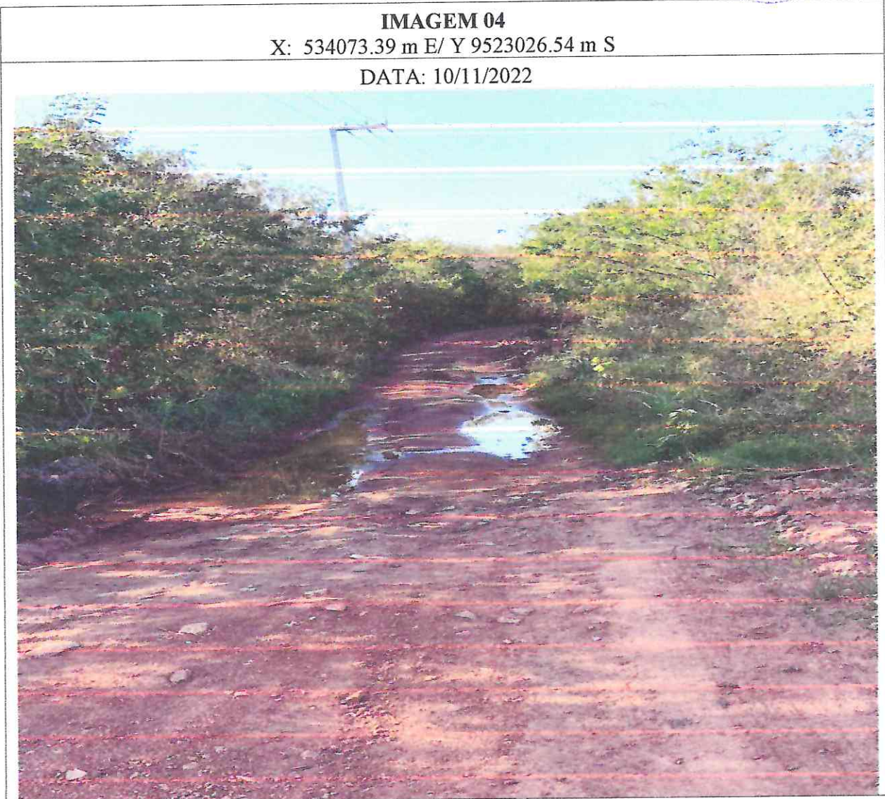
Figura 4: imagens do local da obra