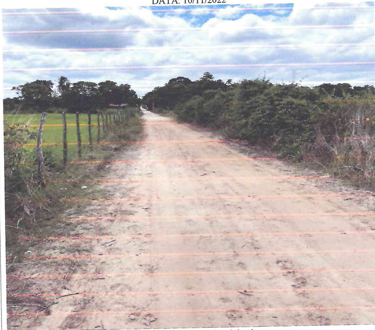
Figura 13: imagens do local da obra