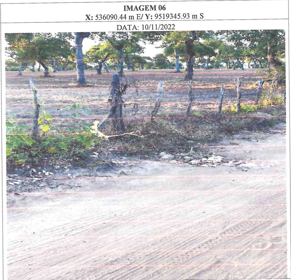
Figura 6: imagens do local da obra