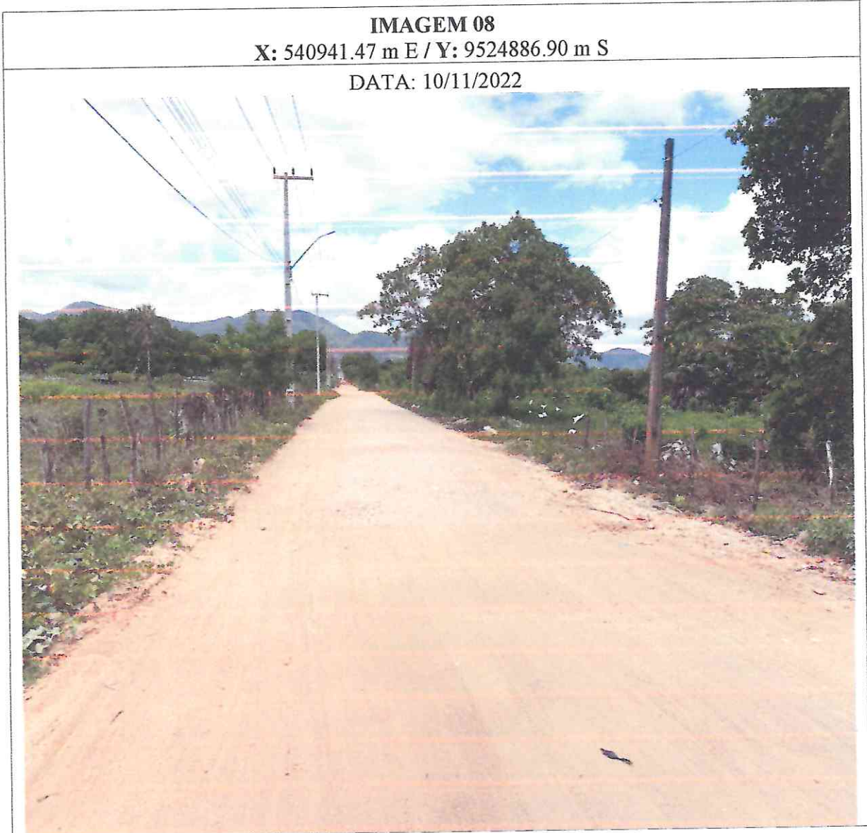
Figura 8: imagens do local da obra