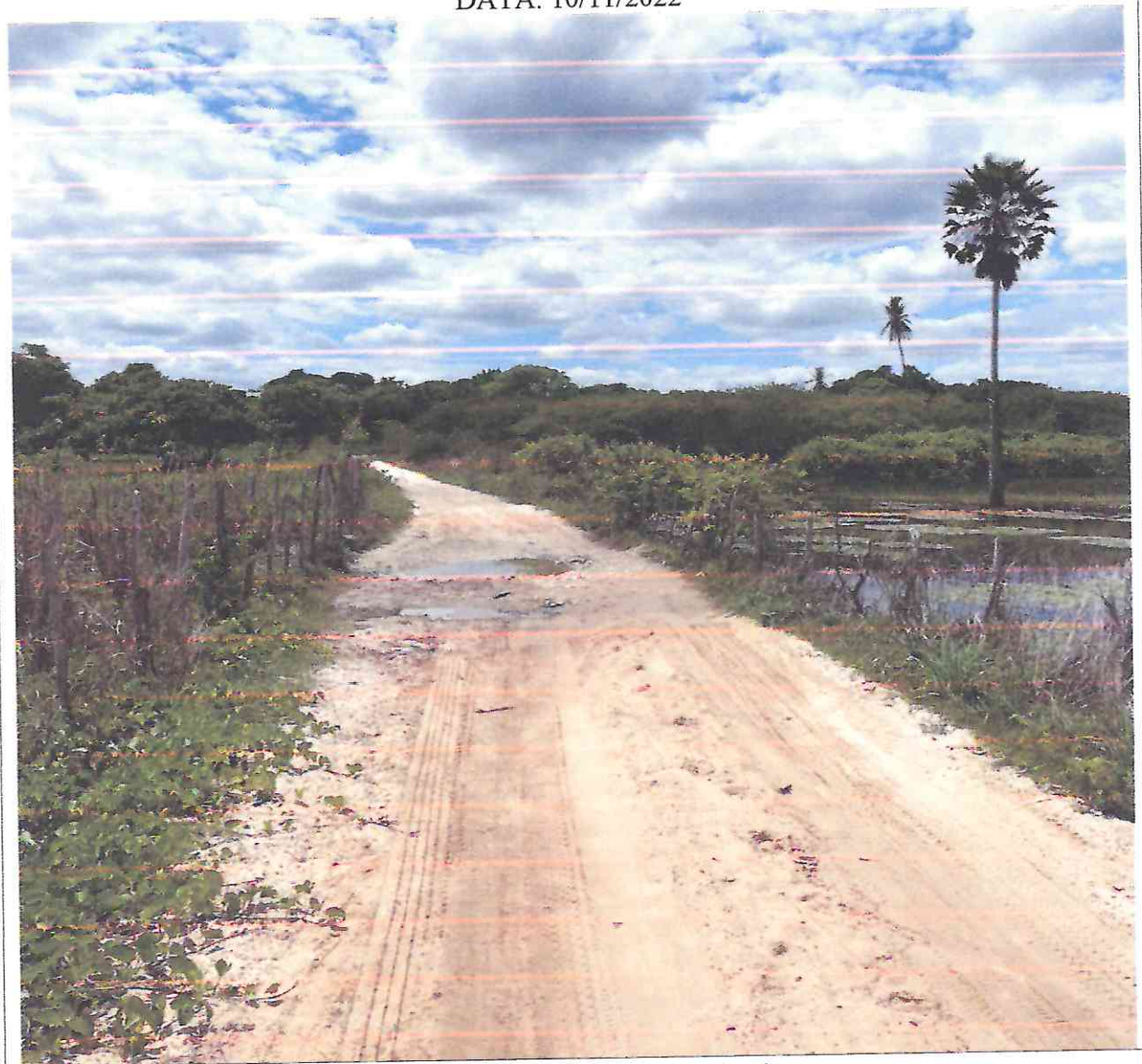
Figura 11: imagens do local da obra

RUA LÚCIO TORRES, Nº 622 CENTRO, CEP: 62795-000 - Barreira / CE www.barreira.ce.gov.br - Email: gabinete.pmb.ce@gmail.com CNPJ: 12.459.632/0001-05 CGF: 06.092.803-9 | Fone: (85) 3331.1631