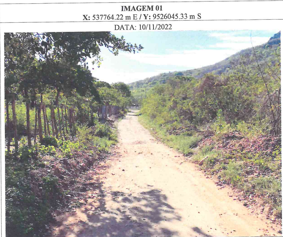
Figura 1: imagens do local da obra