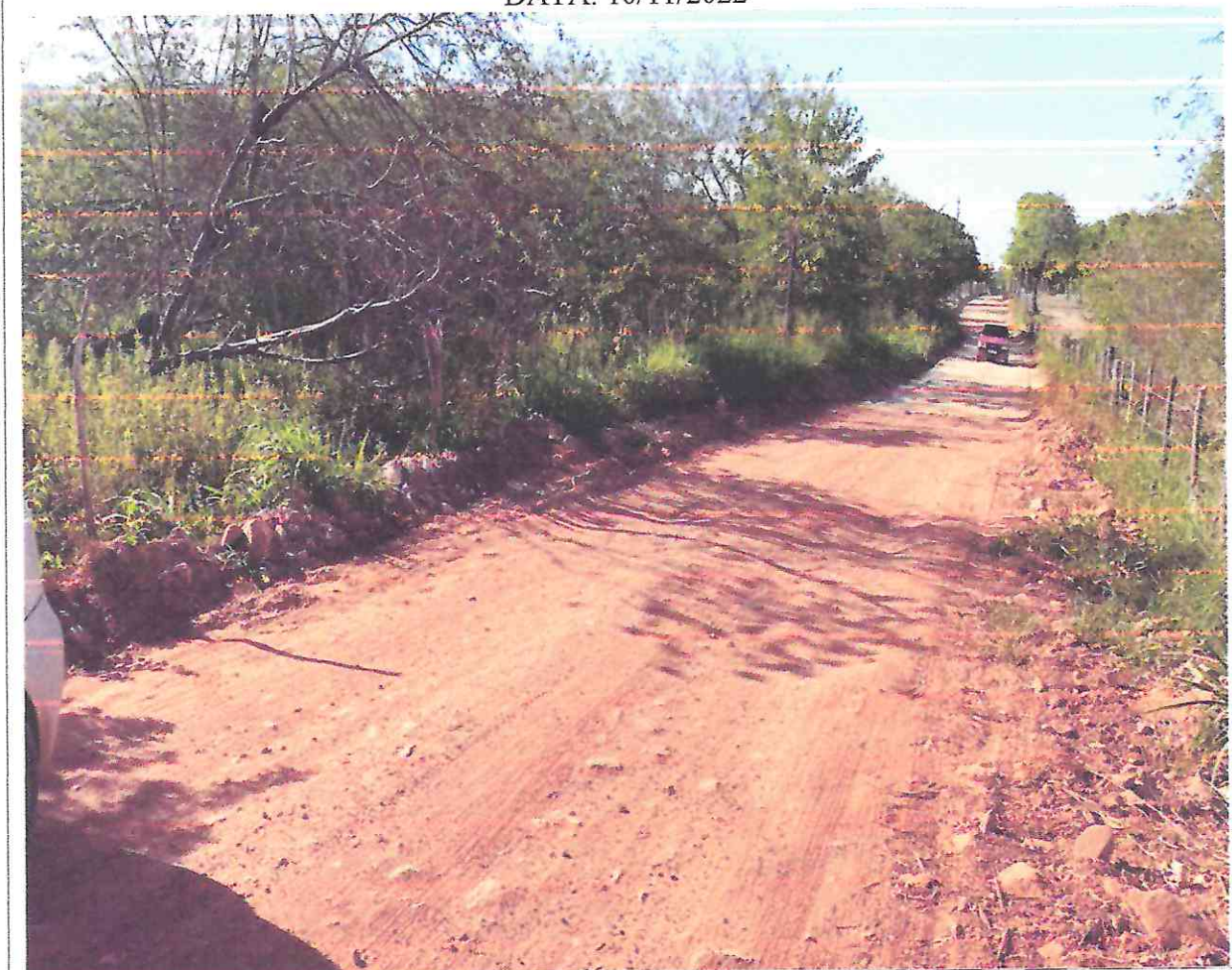
Figura 3: imagens do local da obra